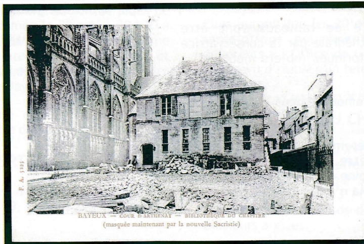
LA BIBLIOTHÈQUE EN 1900

Archives départementales du Calvados 18 F;47/159